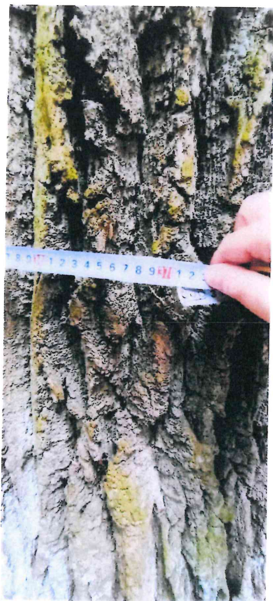
Fot. Obwód pnia zmierzony na wysokości 130 cm.