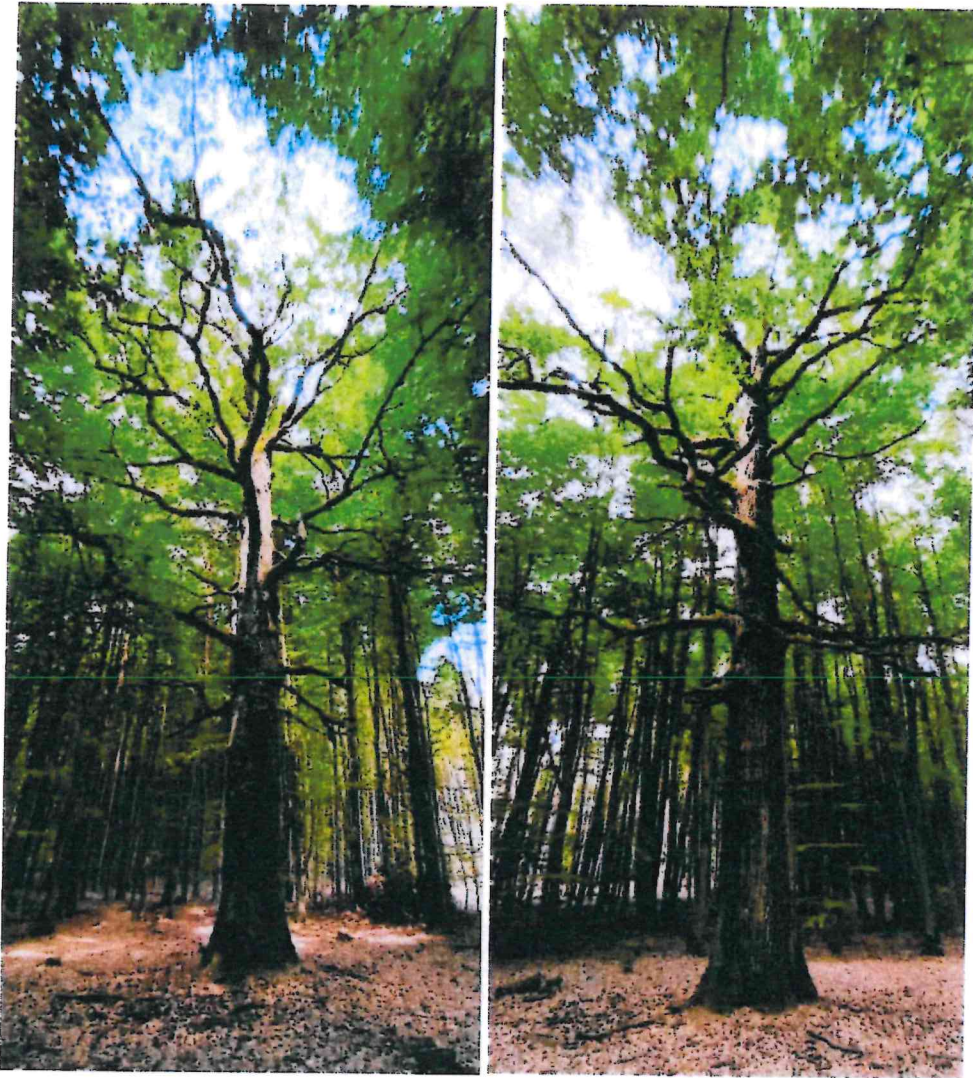
Fot. 3,4 Ogólny widok drzewa w otoczeniu bukowo sosnowym.