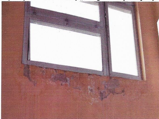
Foto: Bieżący wewnętrzny stan techniczny „sali gimnastycznej” opoczyńskiej Dwójki.

Foto: Bieżący zewnętrzny stan techniczny „sali gimnastycznej” opoczyńskiej Dwójki.