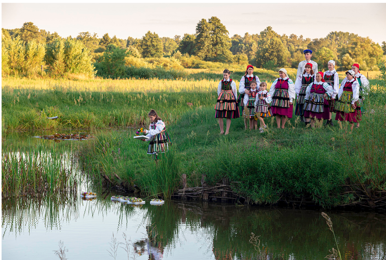
Fotografia 15: