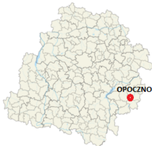
Mapa 2. Położenie gminy Opoczno w województwie łódzkim