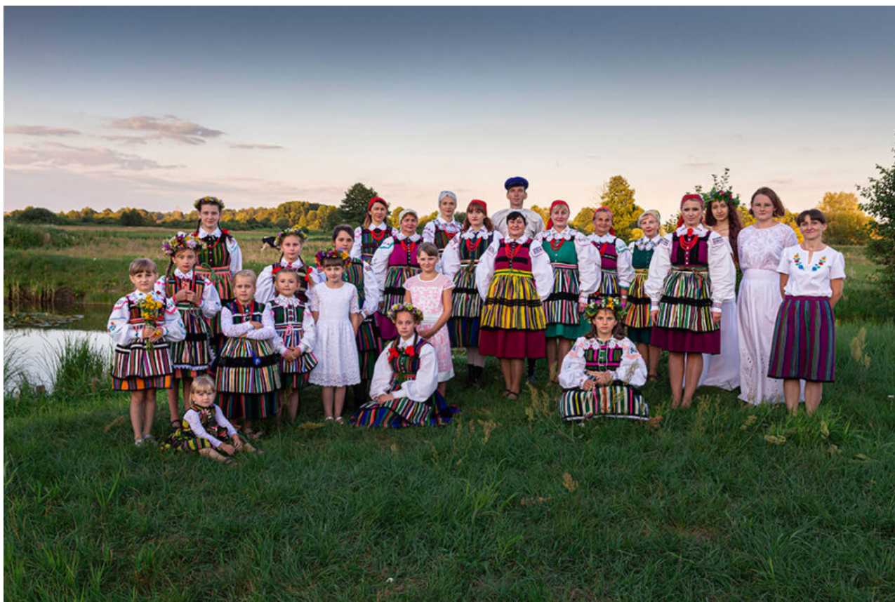
Fotografia 13: http://www.opczynskiszlaczemiosla.pl/tworcy-ludowi/wola-zalezna/

miejscowej szkoły oraz znakomitą okazją do integracji mieszkańców nie tylko w zabawie ale i w organizacji przedsięwzięcia.