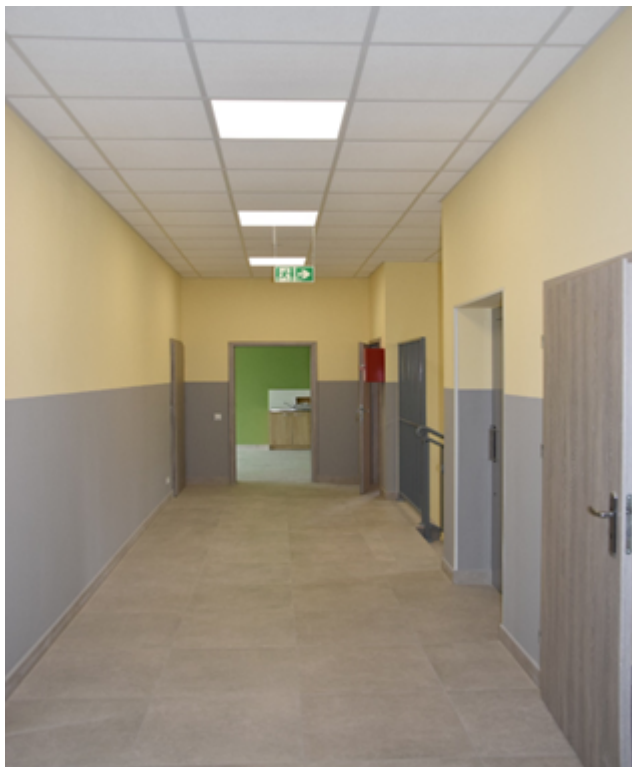
Fotografia 9. Budynek pasywny świetlicy z pomieszczeniami dla potrzeb Szkoły Podstawowej w Woli Załęźnej