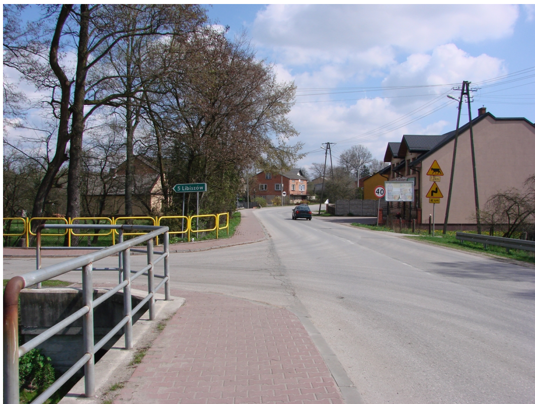
Fotografia 1. Droga powiatowa nr 3108E w kierunku Wygnanowa

Głównym ciągiem komunikacyjnym miejscowości Wola Załęzna jest droga powiatowa 3108E Opoczno – Drzewica. Droga klasy G, posiada nawierzchnię bitumiczną w dobrym stanie. Droga została zmodernizowana w 2007 roku w ramach projektu Powiatu Opoczyńskiego „Przebudowa drogi powiatowej nr 3108E na odcinku Opoczno Wygnanów” dofinansowanego ze środków Unii Europejskiej w ramach Regionalnego Programu Operacyjnego Województwa Łódzkiego na lata 2007-2013.