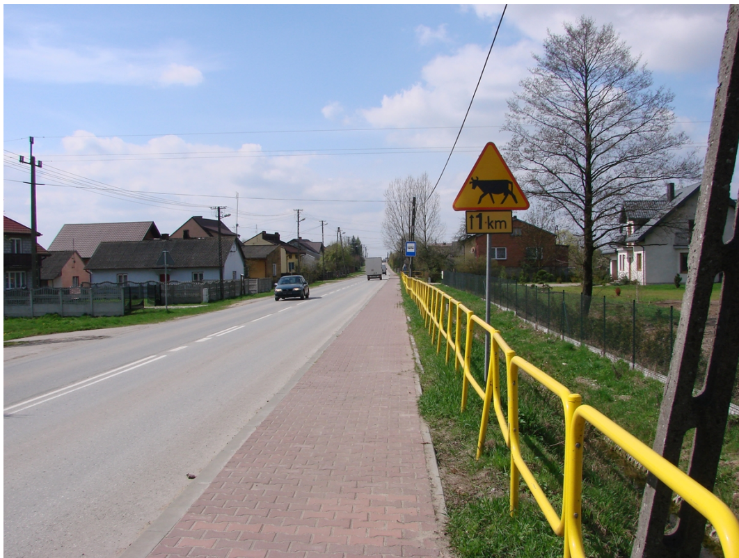
Fotografia 2. Droga powiatowa nr 3108E w kierunku Opczna

Prostopadłą do 30138E jest droga powiatowa 3019E rozpoczynająca się w Woli Załęźnej, prowadząca do Drzewicy. Droga klasy G, o nawierzchni bitumicznej jest w bardzo złym stanie technicznym i wymaga całkowitej przebudowy.