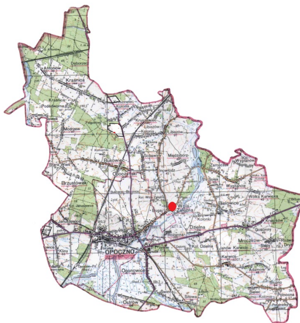
Mapa 4. Położenie Woli Załężnej w Gminie Opoczno.

W miejscowości wyróżnia się 10 części miejscowości wymienionych w wykazie jednostek osadniczych w Rozporządzeniu Ministra Administracji i Cyfryzacji z dnia 17 października 2019 roku w sprawie wykazu urzędowych nazw miejscowości i ich części: