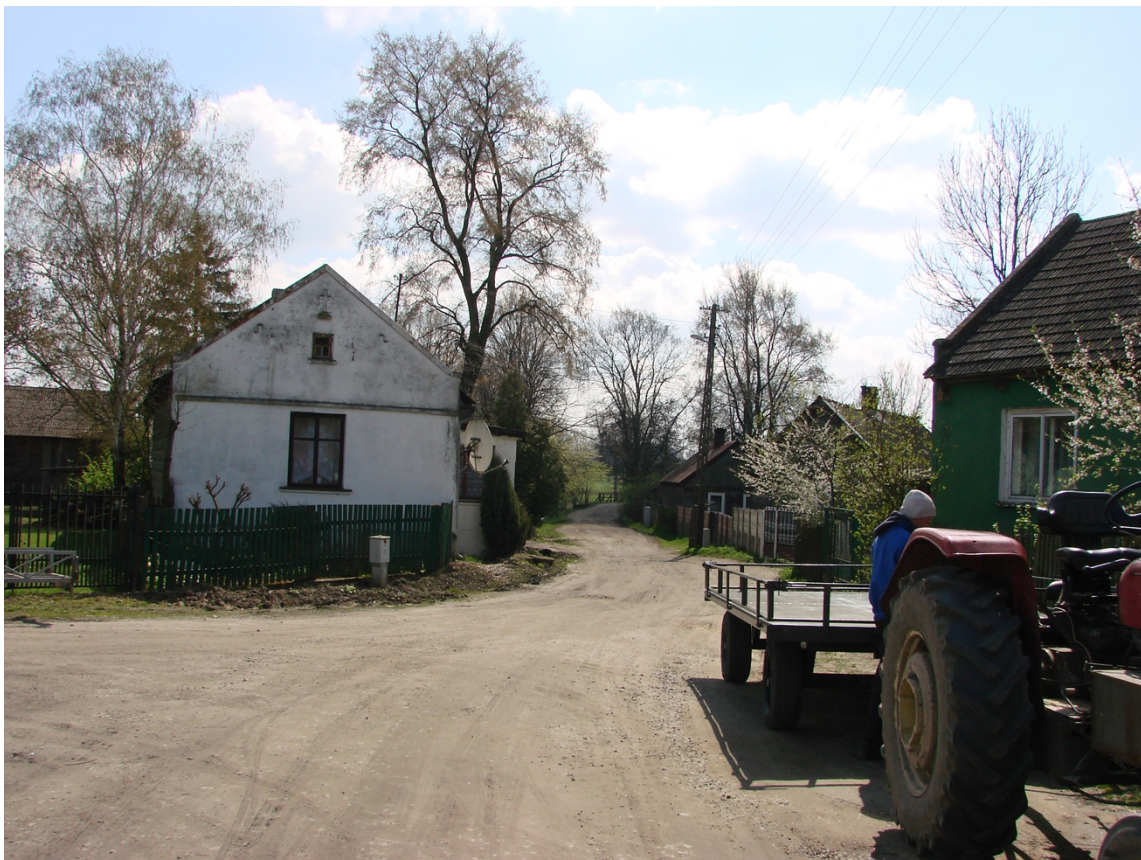
Fotografia 4. Droga gminna nr 107157E w kierunku Dzielnej.

Przez Wolę Załęzną przebiega również droga gminna 107157E Wola Załęzna – Dzielna o nawierzchni gruntowej w bardzo złym stanie – wymagająca budowy. Ponadto miejscowość jest pocięta siatką, w większości gruntowych, dróg dojazdowych do skupisk osadniczych i pól.