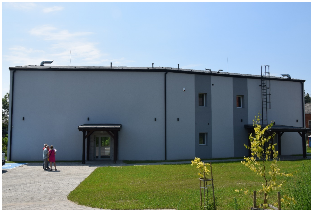
Fotografia 6. Budynek pasywny świetlicy z pomieszczeniami dla potrzeb Szkoły Podstawowej w Woli Załęźnej

Zakres projektu obejmował budowę budynku pasywnego. Powstały budynek składa się z dwóch podstawowych części: świetlicy wiejskiej i części z pomieszczeniami dla szkoły podstawowej, traktowanych jako jeden obiekt z możliwością różnego wykorzystania poszczególnych pomieszczeń w zależności od potrzeb lokalnego społeczeństwa oraz uczniów szkoły.