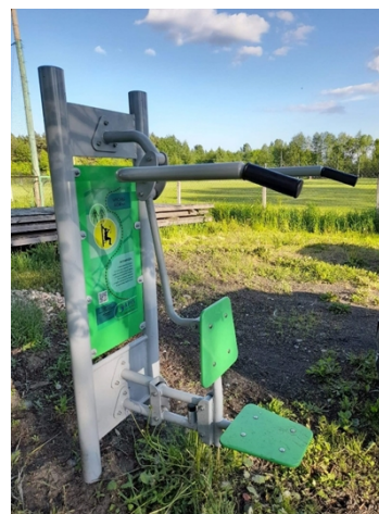
Fotografia 21., 21. Elementy siłowni zewnętrznej.

Wieś jest w całości zwodociągowana. Długość kanalizacji, wybudowanej przez PGK w Opcznie z dofinansowaniem w ramach Programu Operacyjnego Infrastruktura i Środowisko wynosi 7324,5 m.