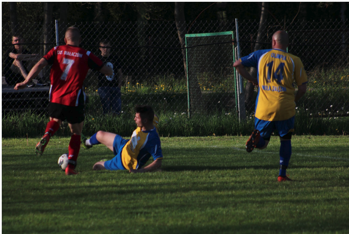
Fotografia 19

Ponadto, w 2021 r. na terenie przy boisku sportowym została wybudowana siłownia zewnętrzna.