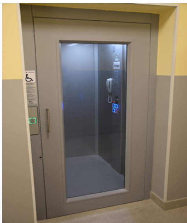
Fotografia 8. Budynek pasywny świetlicy z pomieszczeniami dla potrzeb Szkoły Podstawowej w Woli Załęźnej