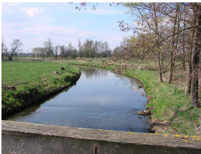
Fotografia 11. Koryto Drzewiczki - widok z Woli Załęźnej w kierunku Opoczna.

Malowniczy krajobraz sołectwa podkreśla również obecność Lasu Wolskiego.