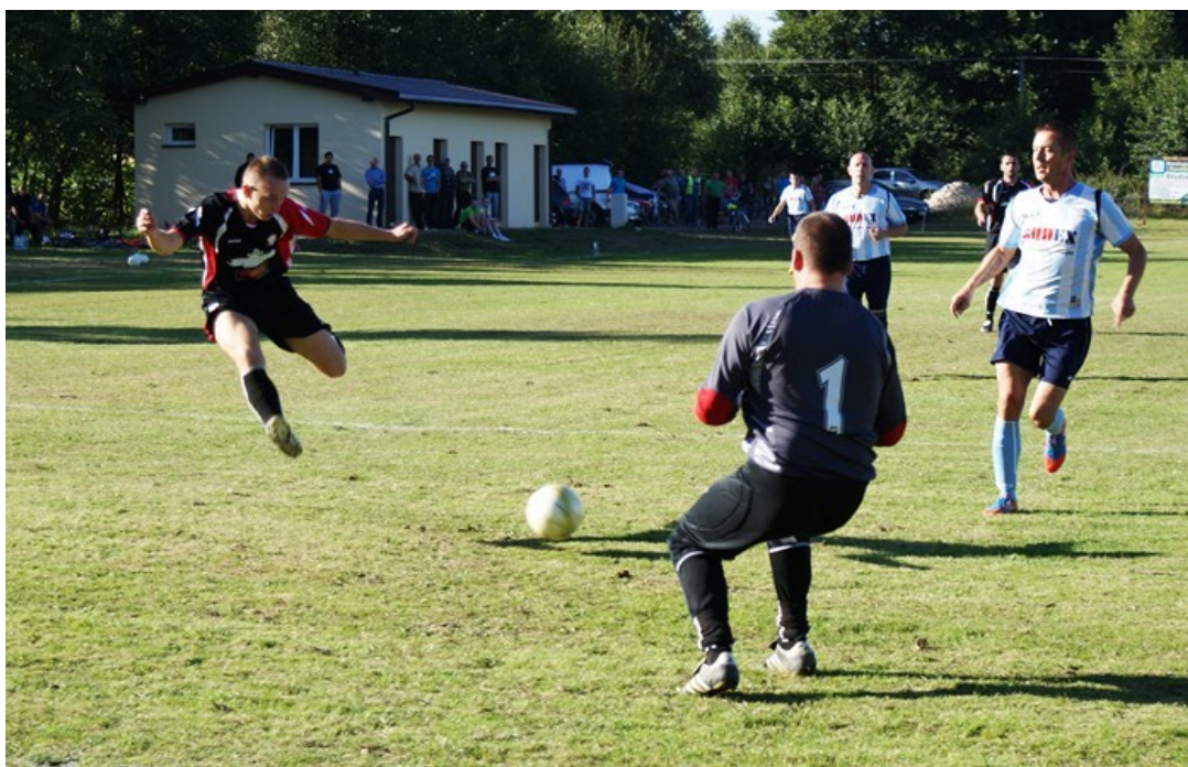
Fotografia 18. Boisko i szatnia w Woli Załęźnej. 10

Obiekt w 2012 roku został wyposażony w szatnię kontenerową zbudowaną w ramach działania 413 „Wdrażanie lokalnych strategii rozwoju” w zakresie operacji odpowiadających warunkom przyznania pomocy w ramach działania „Odnowa i rozwój wsi” objętego Programem Rozwoju Obszarów Wiejskich na lata 2007-2013 dla projektu pn. „Budowa szatni kontenerowej przy boisku sportowym w miejscowości Wola Załęźna”. W budynku znajdują się pomieszczenia dla trenerów i sędziów oraz pomieszczenie na składowanie sprzętu i środków czystości. Szatnia wyposażona jest w instalację elektryczną, wodno-kanalizacyjną, wentylacyjną oraz odgromową.