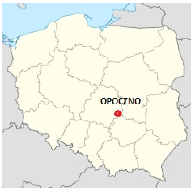
Mapa 1. Położenie gminy Opoczno na tle mapy Polski

Jej rozciągłość południkowa wynosi 20,2 km a równoleżnikowa 19,0 km.