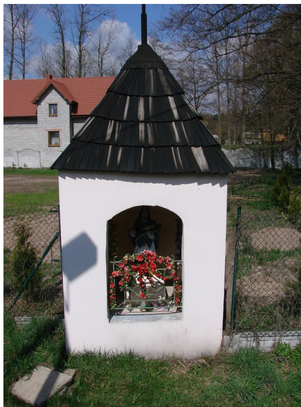
Fotografia 13. Kapliczka przydrożna.