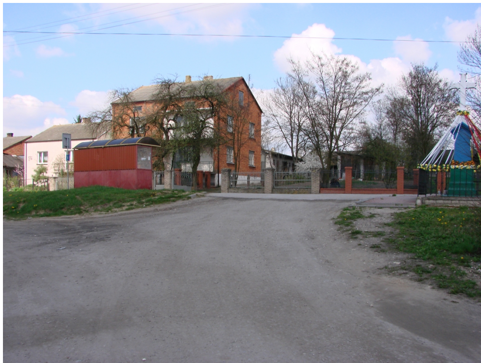
Fotografia 5. Droga gminna nr 107157E – skrzyżowanie z drogą powiatową nr 3109E

Ponadto, w roku 2019 został oddany do użytku most na rzece Drzewiczka. Modernizacja mostu była istotna dla tych mieszkańców wsi, którzy potrzebowali dojechać do swoich łąk i pól, a także dla osób korzystających z drogi w kierunku Bielowic i Dzielnej. Remont mostu obejmował: wymianę poprzecznic drewnianych oraz podkładu dolnego i górnego (nawierzchni), wykonanie zabezpieczenia antykorozyjnego belek stalowych i wykonanie podbudowy z kamienia łamanego na dojazdach do mostu.