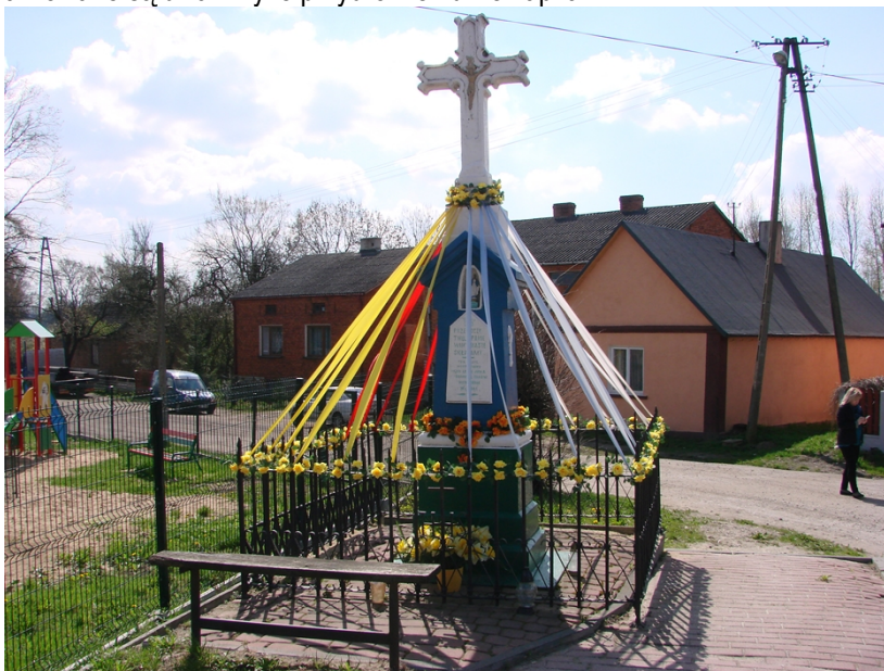
Fotografia 12. Kapliczka na rozstaju dróg z 1901 roku.

W Woli Załężnej zlokalizowane są dwa krzyże przydrożne i dwie kapliczki.