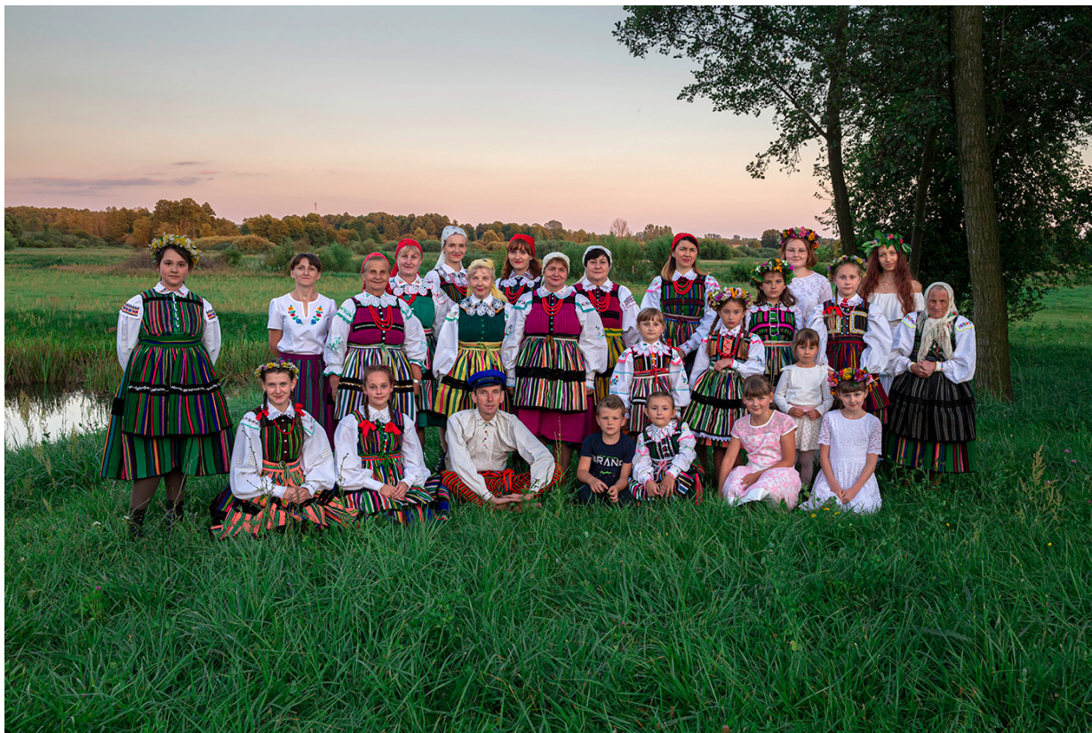
Fotografia 14: http://www.opoczynskislakrzemiosla.pl/tworcy-ludowi/wola-zalezna/