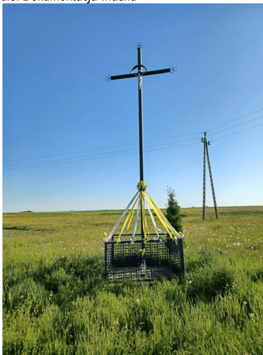
Zdjęcie 3. Pożegnalny krzyż przydrożny z 1986 r. postawiony przez mieszkańca Międzyborza.