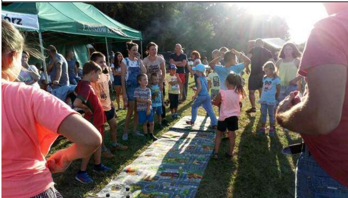
Zdjęcie 25. Piknik rodzinny „Jak na pierogi to do Międzyborza”