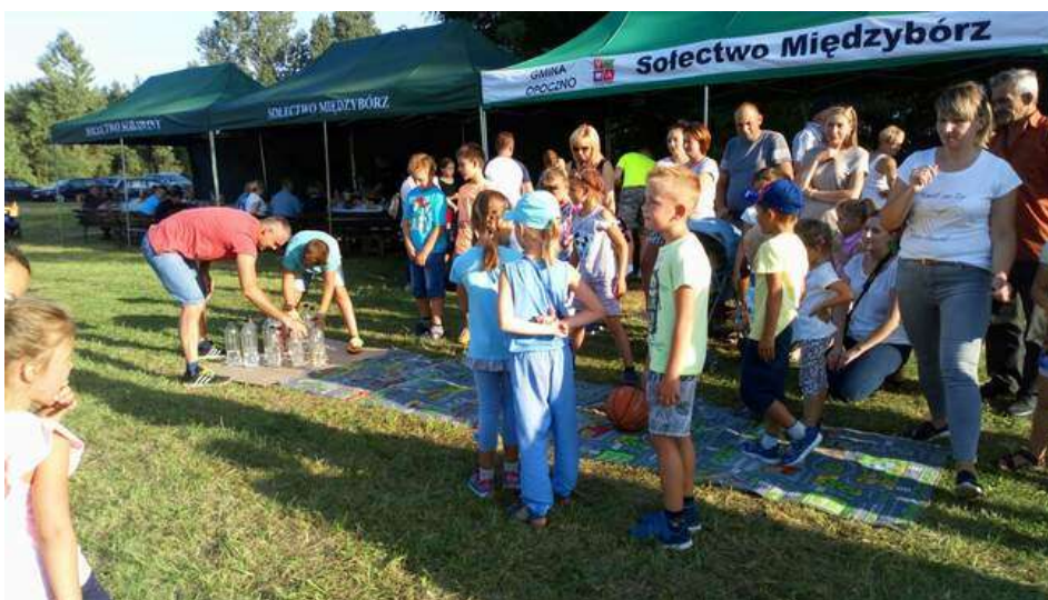
Zdjęcie 22. Piknik rodzinny „Jak na pierogi to do Międzybórza”

Mieszkańcy sołectwa chcą, aby we wsi kontakty wszystkich mieszkańców niezależnie od wieku przyczyniły się do zmniejszenia dystansu między pokoleniami, który w związku ze współczesnym stylem życia pogłębia się szczególnie między pokoleniem starszym a młodszym. Witalność i kreatywność młodych w połączeniu z wiedzą i doświadczeniem starszych mogą przynieść wiele pożytku, kiedy zostaną wykorzystane we wspólnych inicjatywach. W związku z tym, aby zintegrować lokalną społeczność organizowane są pikniki rodzinne i wszelkie podobne inicjatywy na rzecz lokalnej społeczności, które angażują zarówno młodych jak i starszych mieszkańców wsi.