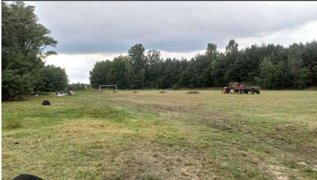
Zdjęcie 21. Wspólne sprzątanie wsi.

Mieszkańcy sołectwa chcą, aby we wsi kontakty wszystkich mieszkańców niezależnie od wieku przyczyniły się do zmniejszenia dystansu między pokoleniami, który w związku ze współczesnym stylem życia pogłębia się szczególnie między pokoleniem starszym a młodszym. Witalność i kreatywność młodych w połączeniu z wiedzą i doświadczeniem starszych mogą przynieść wiele pożytku, kiedy zostaną wykorzystane we wspólnych inicjatywach. W związku z tym, aby zintegrować lokalną społeczność organizowane są pikniki rodzinne i wszelkie podobne inicjatywy na rzecz lokalnej społeczności, które angażują zarówno młodych jak i starszych mieszkańców wsi.