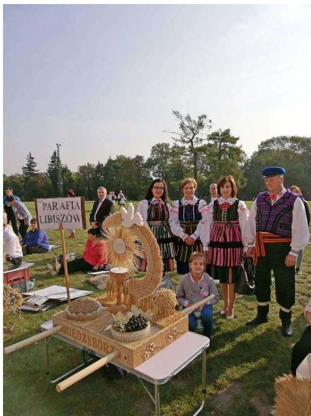
Zdjęcie 18. Dożynki parafialne.