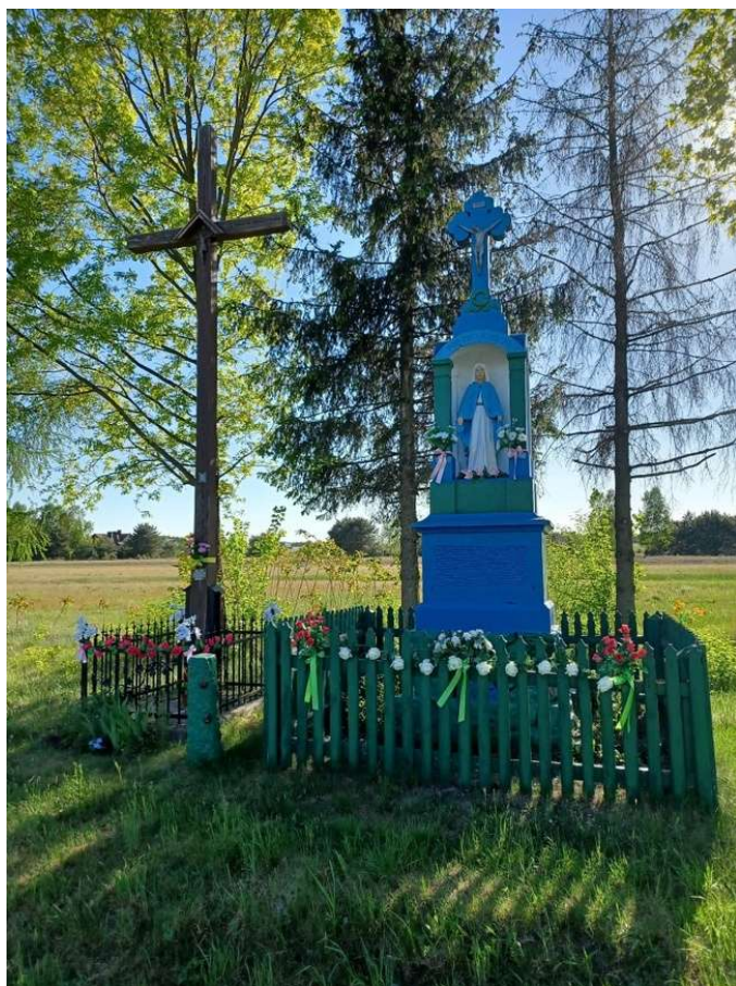
Zdjęcie 5. Kapliczka wotywna "Pod Twoją Obronę" oraz krzyż drewniany "Na pamiątkę pontyfikaty Ojca Świętego Jana Pawła II" ufundowany przez małżeństwo Kośków z Międzyborza w 2005 roku.