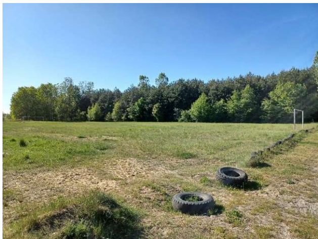
Zdjęcie 10. Boisko do piłki nożnej w Międzyborzu.

W 2020 roku utworzono boisko do plażowej piłki siatkowej oraz została rozpoczęta budowa placu zabaw dla najmłodszych mieszkańców wsi. W 2022 roku planowana jest dalsza jego rozbudowa w formie doposażenia nowymi sprzętami. Planowane jest również ogrodzenie tego terenu, aby dzieci mogły z niego bezpiecznie korzystać. Oba boiska i plac zabaw powstał na działkach, które są własnością gminy Opoczno.