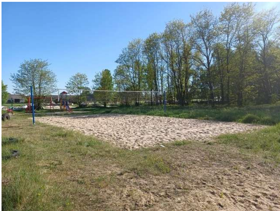
Zdjęcie 11. Boisko do piłki plażowej w Międzybórze.