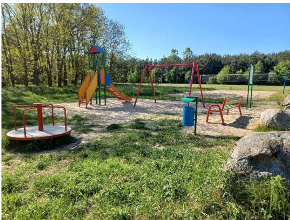
Zdjęcie 14. Plac zabaw w Międzyborzu.

Miejsca te stały się dodatkowym miejscem spotkań, integracji społecznej oraz propagowania zdrowego, sportowego trybu życia.