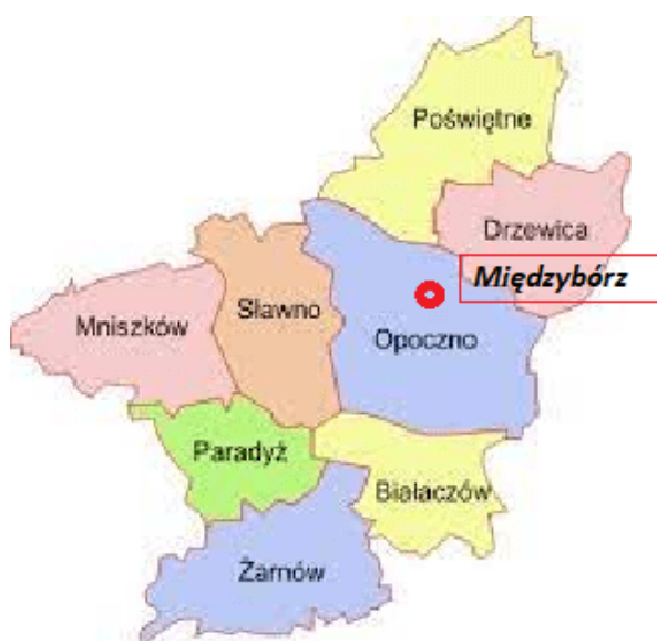
Mapa 3. Położenie Międzyborza na terenie Gminy Opoczno w powiecie opoczyńskim

Opoczno jest gminą miejsko – wiejską, którą tworzy miasto Opoczno oraz 40 miejscowości, w tym 34 o statusie sołectwa: Adamów, Antoniów, Bielowice, Brzustówek, Bukowiec Opoczyński, Dzielna, Januszewice, Janów Karwicki, Kliny, Karwice, Kraśnica, Kraszków, Kruszewiec, Kruszewiec Kolonia, Libiszów, Libiszów Kolonia, Międzybórz, Modrzew, Modrzewek, Mroczków Duży, Mroczków Gościny, Ogonowice, Ostrów, Różanna, Sielec, Sitowa, Międzybórz, Sołek, Stuzno, Stuzno Kolonia, Wola Załączna, Wólka Karwicka, Wygnanów, Ziębów.