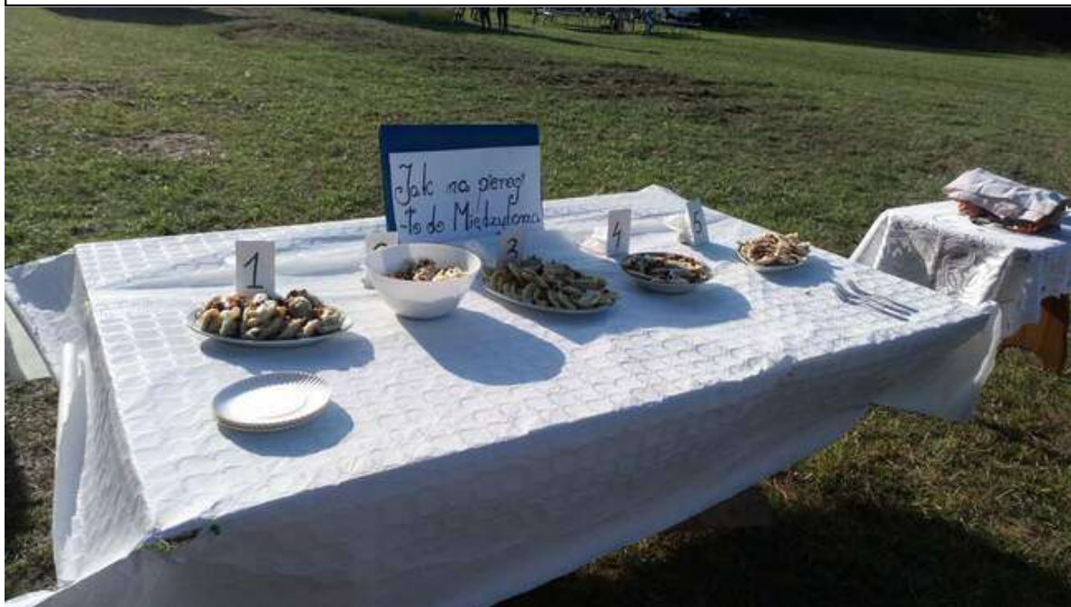
Zdjęcie 23. Piknik rodzinny „Jak na pierogi to do Międzyborza”