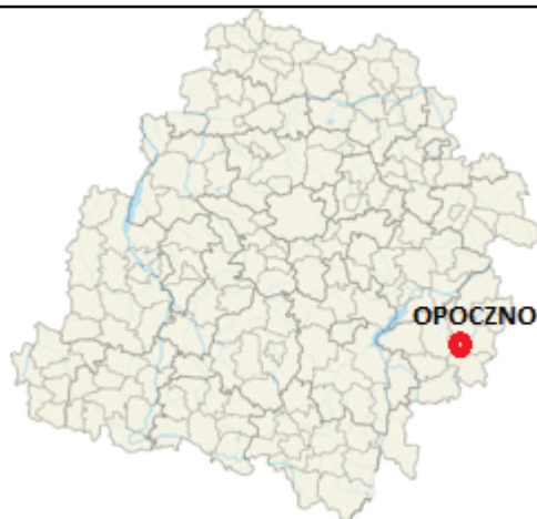
Mapa 2. Położenie gminy Opoczno w województwie łódzkim