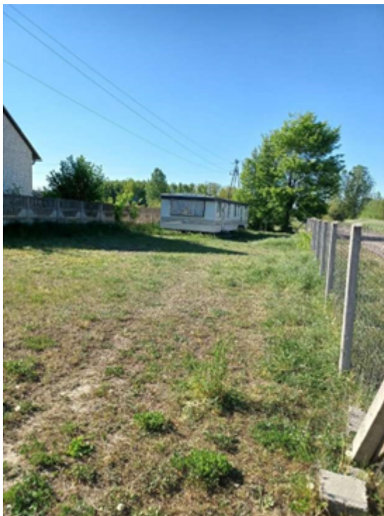
Zdjęcie 9. Domek holenderski we wsi Międzybórz.

W 2018 roku zakupiono ze środków funduszu sołeckiego domek holenderski, który służy mieszkańcom Międzyborza jako świetlica wiejska do różnorodnych spotkań i zebrań społeczności Międzyborza.