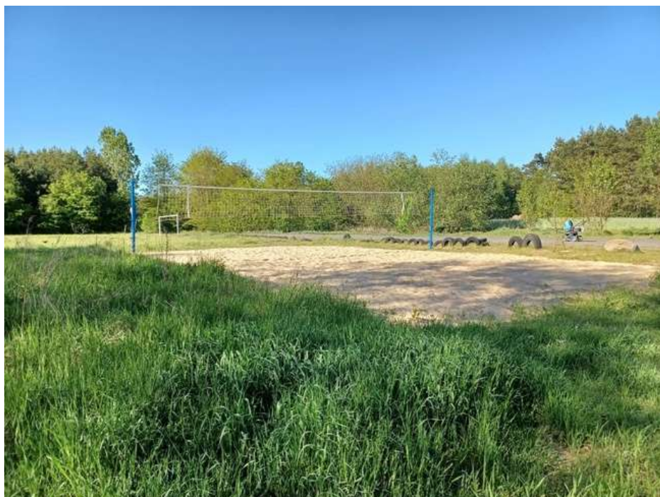
Zdjęcie 12. Boisko do piłki plażowej w Międzybórze.