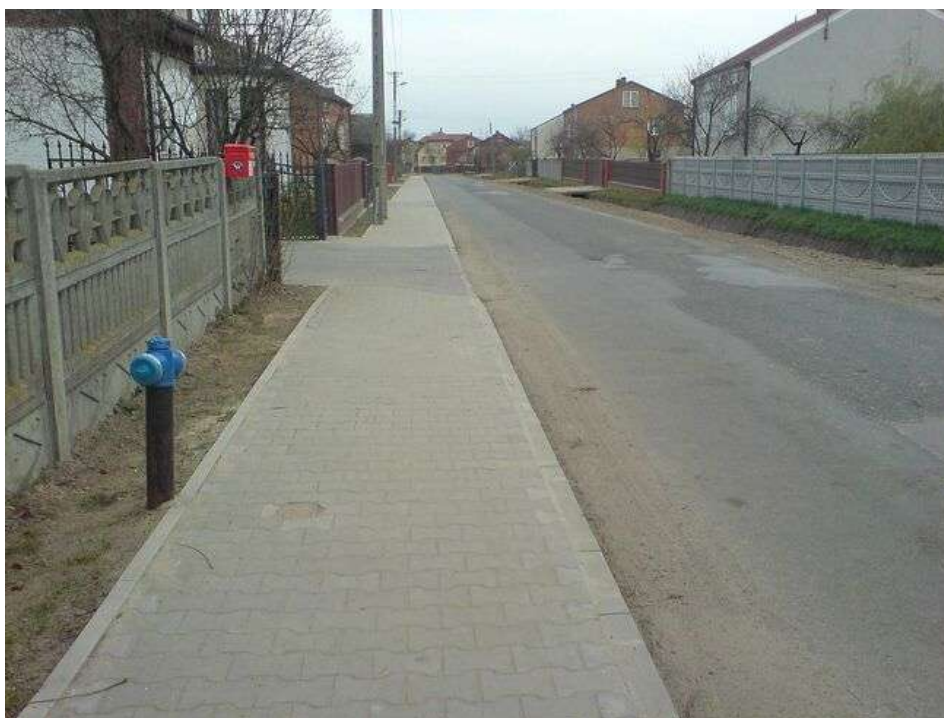
Zdjęcie 6. Zabudowa oraz droga w Międzyborzu.

Ponadto, charakterystyczną cechą Międzyborza jest zwarta zabudowa domów po obu stronach drogi, więc typ tej wsi to „ulicówka”.