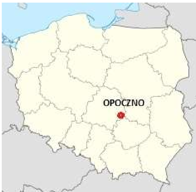
Mapa 1. Położenie gminy Opoczno na tle mapy Polski

Jej rozciągłość południkowa wynosi 20,2 km a równoleżnikowa 19,0 km.