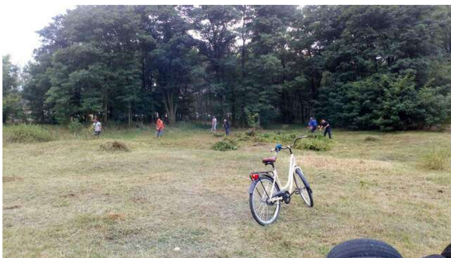
Zdjęcie 20. Wspólne sprzątanie wsi.

Mieszkańcy angażują się również w akcje na rzecz wsi. Poniżej zdjęcia ze wspólnego sprzątania wsi po okresie zimowym.