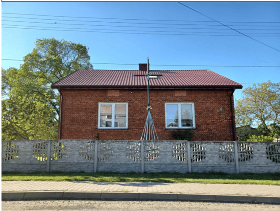
Zdjęcie 2. Stalowy krzyż przydrożny pochodzący z 1989 r. ufundowany przez rodzinę z Międzyborza na miejscu drewnianego krzyża z 1957 r.