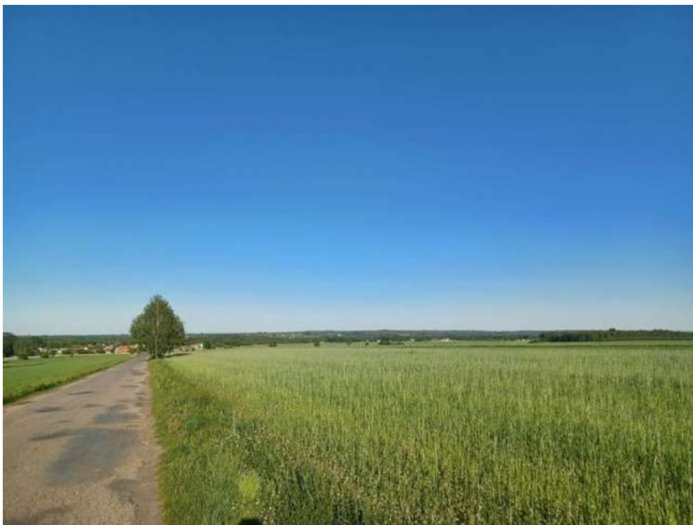
Zdjęcie 7. Punkt widokowy.

Na terenie sołectwa Międzybórz nie występują żadne zasoby przyrodnicze. Jediną atrakcją krajobrazową jest punkt widokowy, który znajduje się na drodze powiatowej nr 3101 E jadąc z miejscowości Sobawiny do Międzyborza.