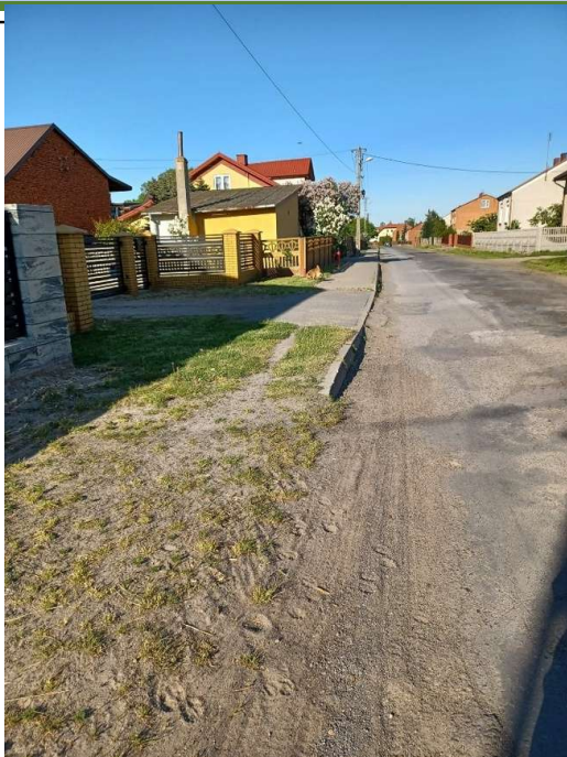
Zdjęcie 15. Zdjęcie ukazuje koniec chodnika w środku wsi.