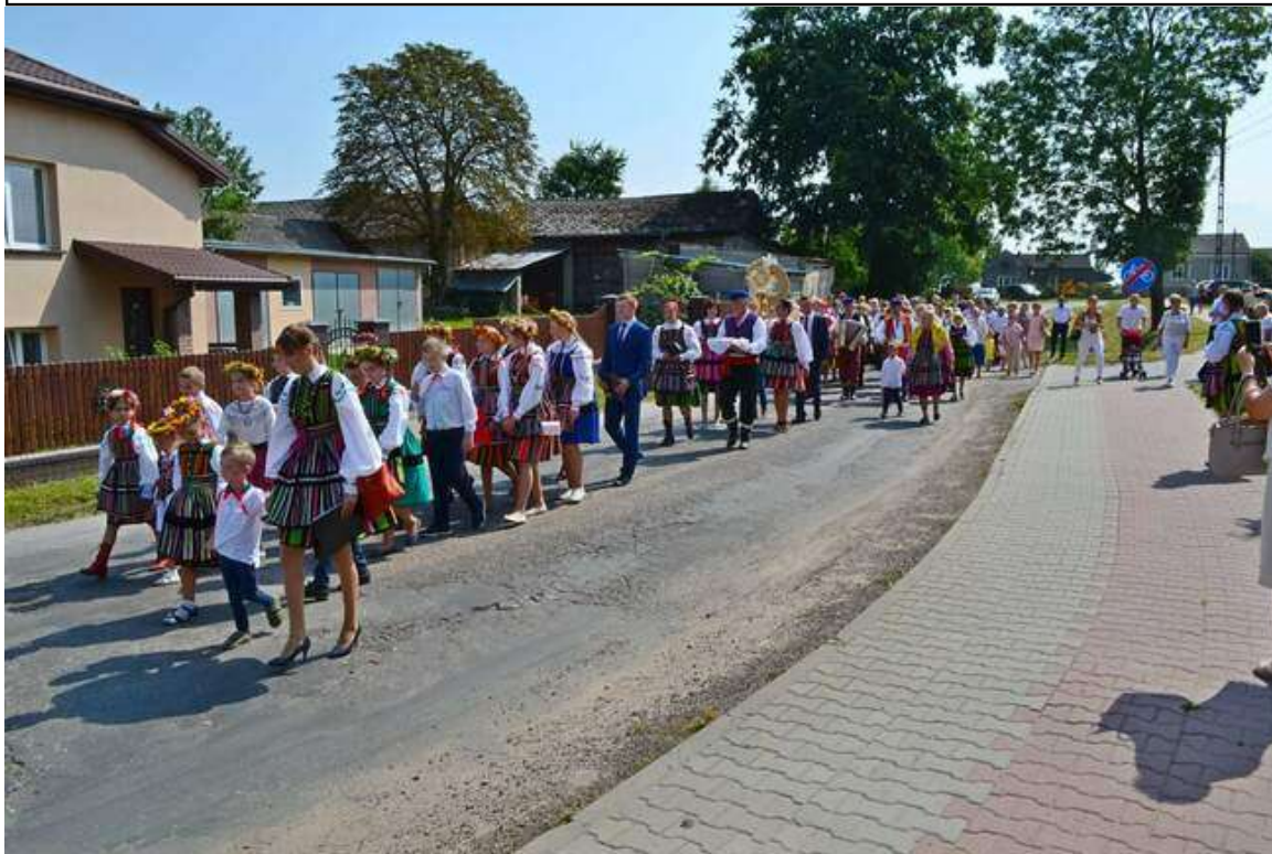
Zdjęcie 17. Dożynki parafialne.