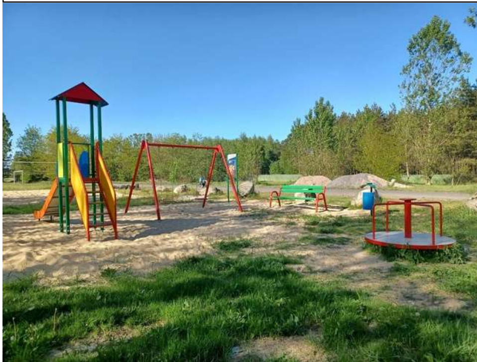
Zdjęcie 13. Plac zabaw w Międzyborzu.