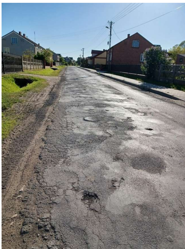
Zdjęcie 16. Zdjęcie ukazuje drogę biegnącą w środku wsi.