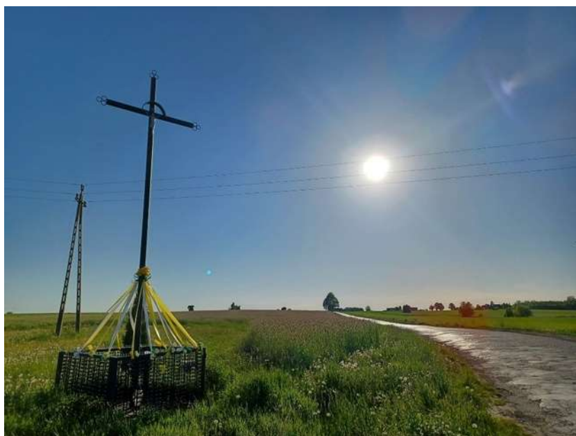
Zdjęcie 4. Pożegnalny krzyż przydrożny z 1986 r. postawiony przez mieszkańca Międzyborza.