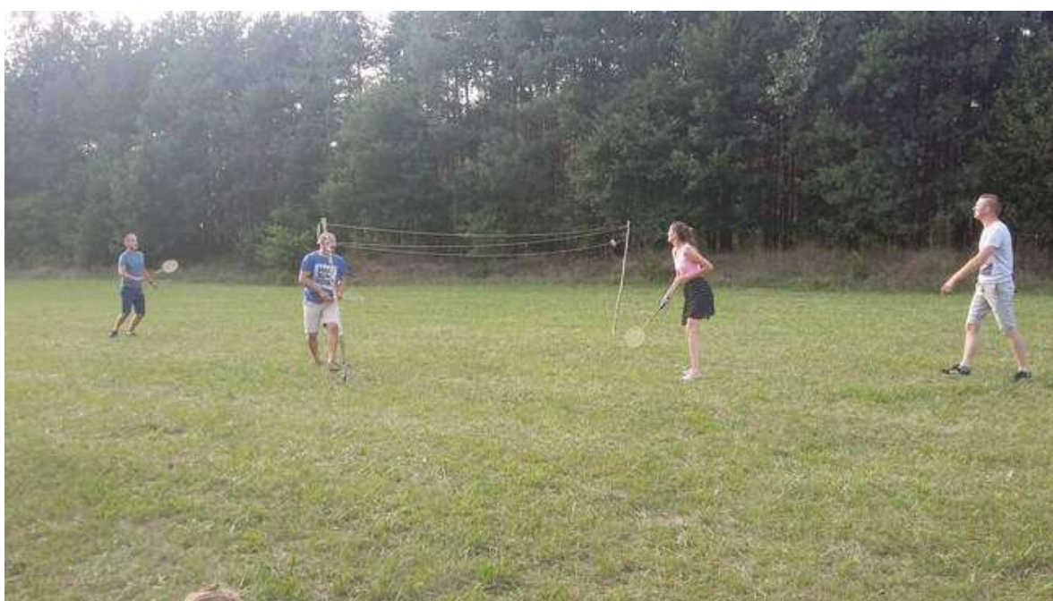
Zdjęcie 24. Piknik rodzinny „Jak na pierogi to do Międzyborza”