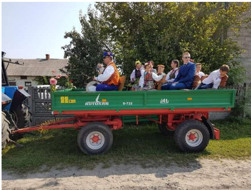
Zdjęcie 19. Dożynki parafialne.

Mieszkańcy angażują się również w akcje na rzecz wsi. Poniżej zdjęcia ze wspólnego sprzątania wsi po okresie zimowym.