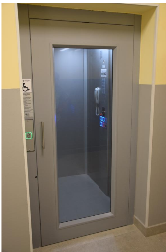
Fotografia 8. Budynek pasywny świetlicy z pomieszczeniami dla potrzeb Szkoły Podstawowej w Woli Załęźnej