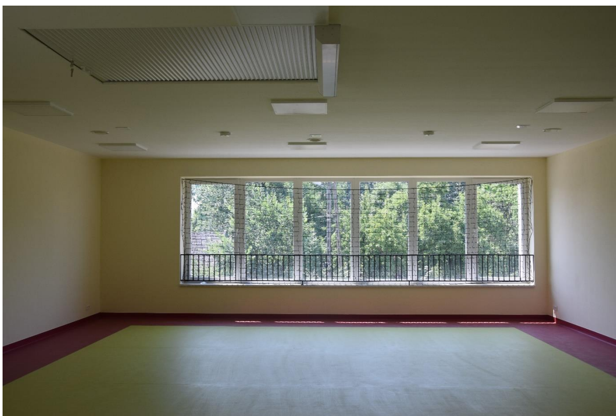
Fotografia 10. Budynek pasywny świetlicy z pomieszczeniami dla potrzeb Szkoły Podstawowej w Woli Załęźnej

W Woli Załęźnej bardzo prężnie działa Koło Gospodyń Wiejskich oraz cieszący się uznaniem zespół śpiewaczy „Wolowianki”.