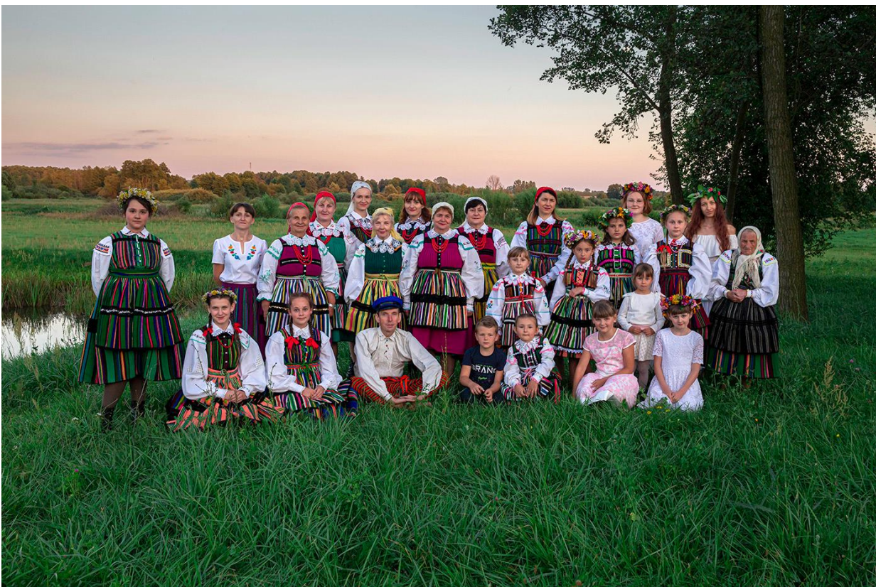
Fotografia 14: