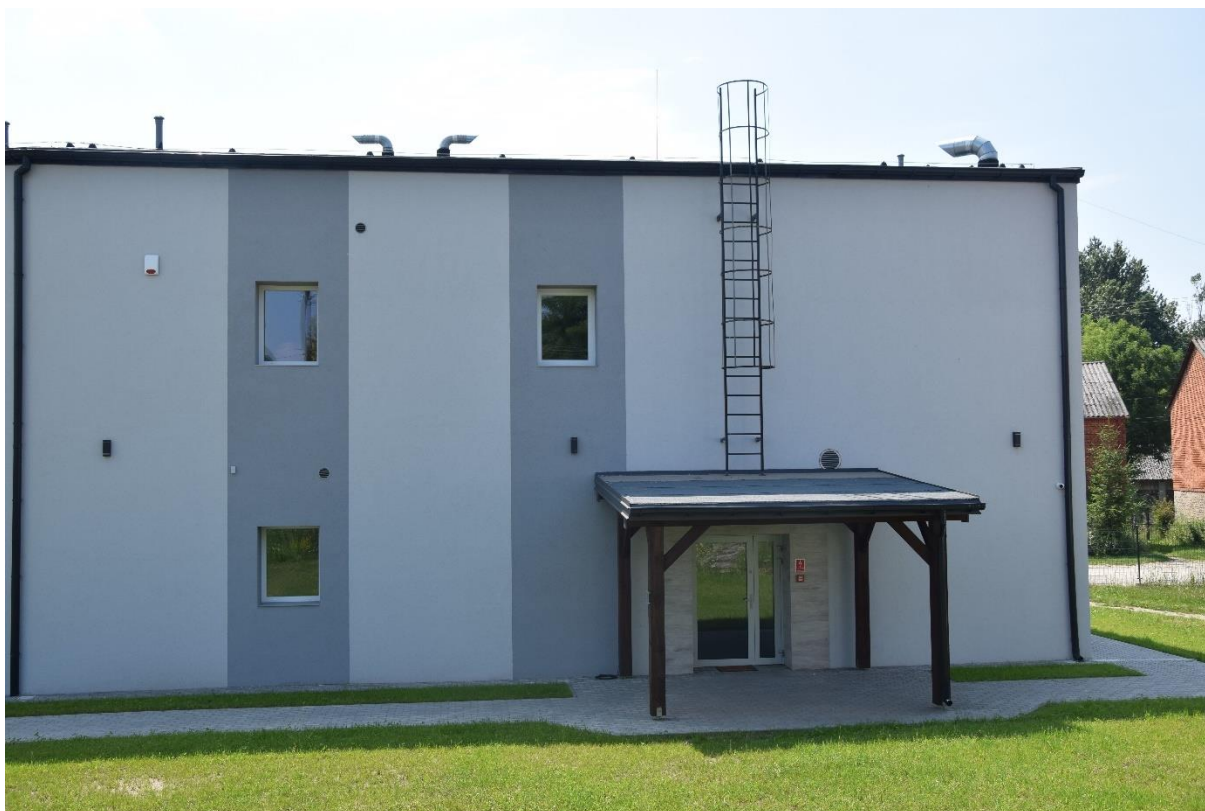
Fotografia 7. Budynek pasywny świetlicy z pomieszczeniami dla potrzeb Szkoły Podstawowej w Woli Załęźnej