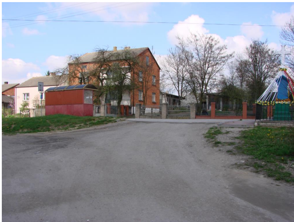
Fotografia 5. Droga gminna nr 107157E – skrzyżowanie z drogą powiatową nr 3109E

Ponadto, w roku 2019 został oddany do użytku most na rzece Drzewiczka. Modernizacja mostu była istotna dla tych mieszkańców wsi, którzy potrzebowali dojechać do swoich łąk i pól, a także dla osób korzystających z drogi w kierunku Bielowic i Dzielnej. Remont mostu obejmował: wymianę poprzecznic drewnianych oraz podkładu dolnego i górnego (nawierzchni), wykonanie zabezpieczenia antykorozyjnego belek stalowych i wykonanie podbudowy z kamienia łamanego na dojazdach do mostu.