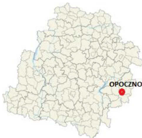
Mapa 2. Położenie gminy Opoczno w województwie łódzkim