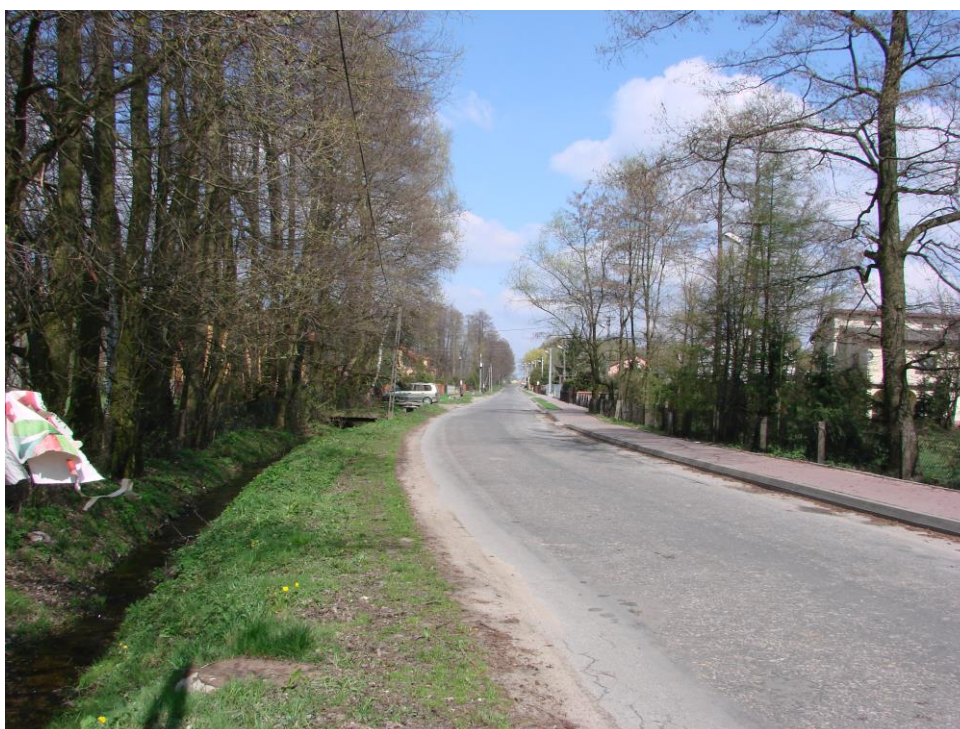
Fotografia 3. Droga powiatowa nr 3109E w kierunku Libiszowa

Prostopadłą do 30138E jest droga powiatowa 3019E rozpoczynająca się w Woli Załęźnej, prowadząca do Drzewicy. Droga klasy G, o nawierzchni bitumicznej jest w bardzo złym stanie technicznym i wymaga całkowitej przebudowy.