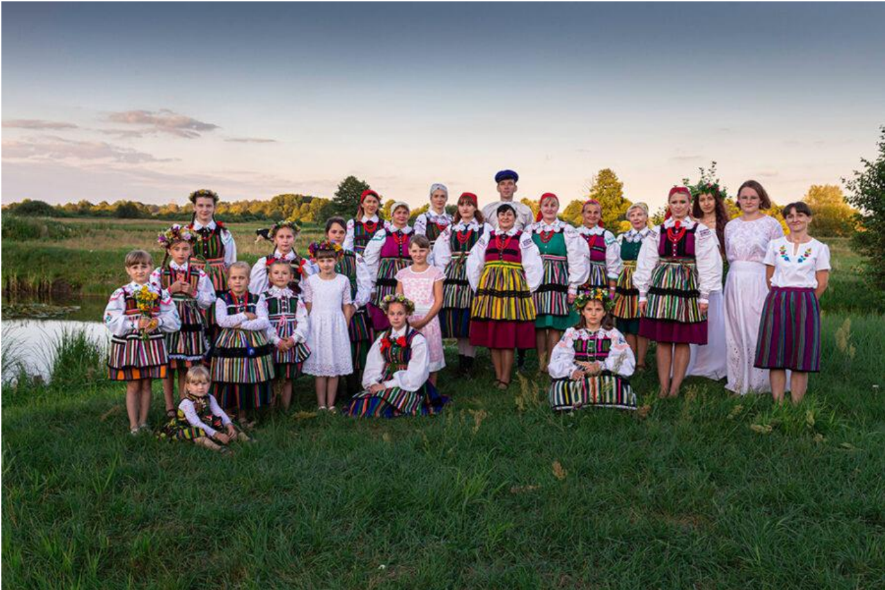
Fotografia 13: http://www.opoczynskislakrzemiosla.pl/tworcy-ludowi/wola-zalezna/