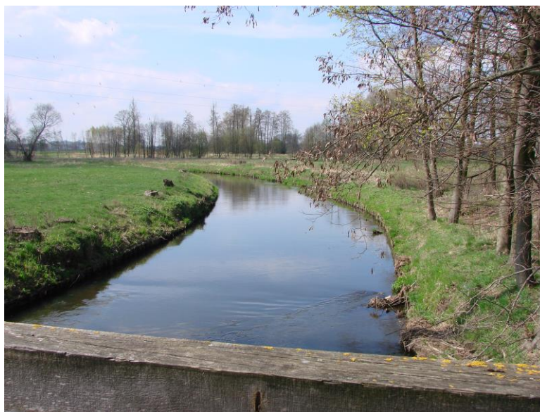
Fotografia 11. Koryto Drzewiczki - widok z Woli Załęźnej w kierunku Opoczna.

Malowniczy krajobraz sołectwa podkreśla również obecność Lasu Wolskiego.