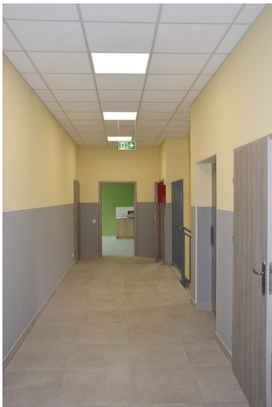
Fotografia 9. Budynek pasywny świetlicy z pomieszczeniami dla potrzeb Szkoły Podstawowej w Woli Załęźnej