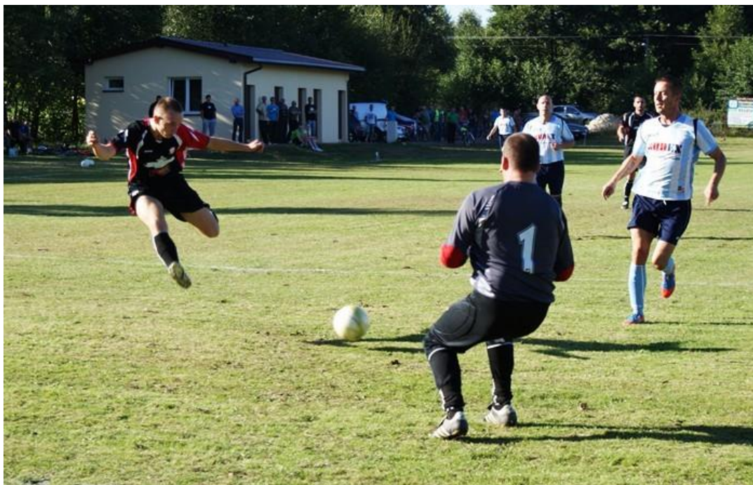
Fotografia 18. Boisko i szatnia w Woli Załęźnej. 10