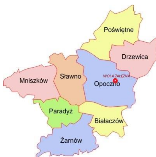
Mapa 3. Położenie gminy Opoczno w powiecie opoczyńskim

Opoczno jest gminą miejsko – wiejską, którą tworzy miasto Opoczno oraz 40 miejscowości, w tym 34 o statusie sołectwa: Adamów, Antoniów, Bielowice, Brzustówek, Bukowiec Opoczyński, Dzielna, Januszewice, Janów Karwicki, Kliny, Karwice, Kraśnica, Kraszków, Kruszewiec, Kruszewiec Kolonia, Libiszów, Libiszów Kolonia, Międzybórz, Modrzew, Modrzewek, Mroczków Duży, Mroczków Gościnnie, Ogonowice, Ostrów, Różanna, Sielec, Sitowa, Sobawiny, Sołek, Stuzno, Stuzno Kolonia, Wola Załączna, Wólka Karwicka, Wygnanów, Ziębów.