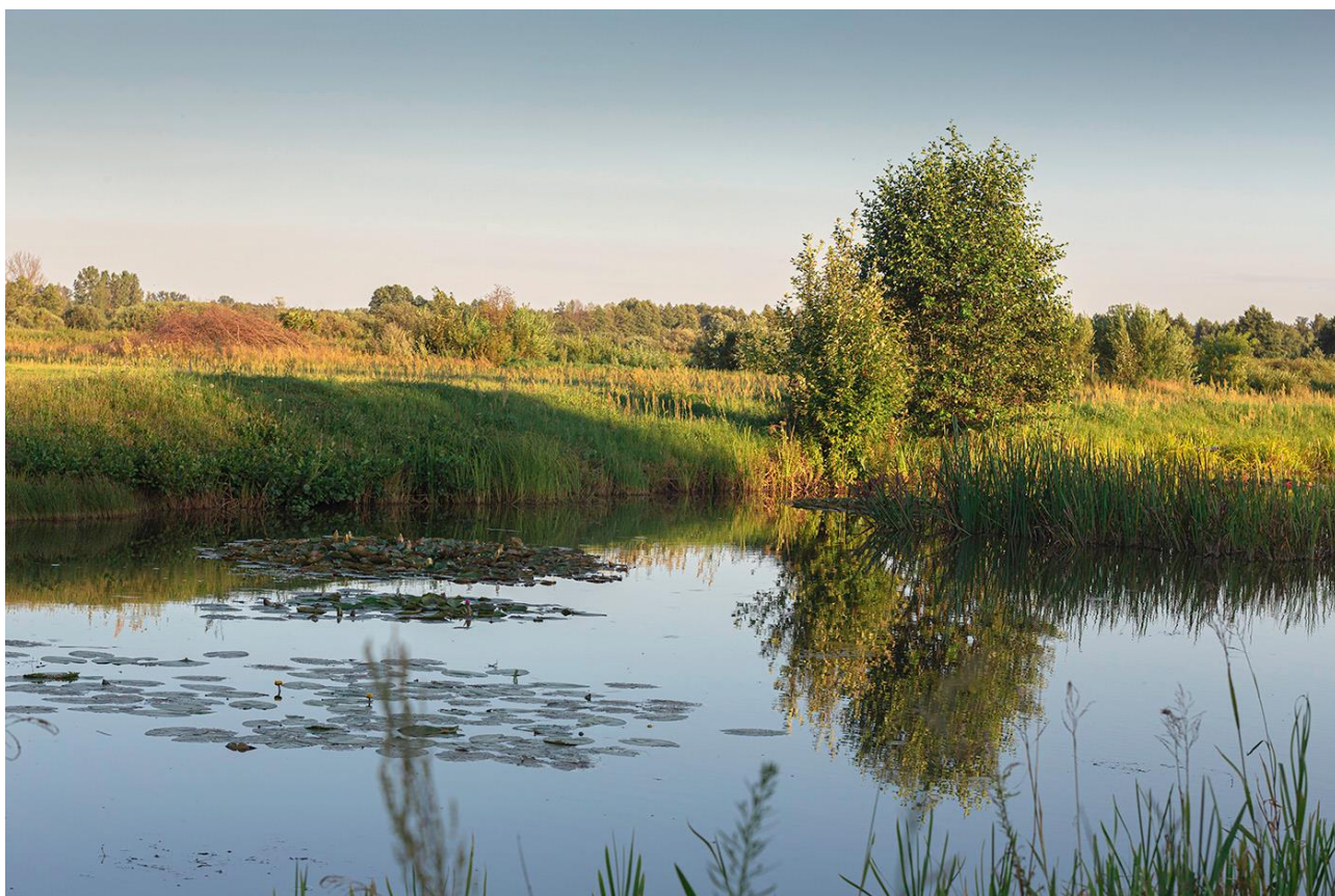
Fotografia 17:

O wysokiej jakości kapitału społecznego miejscowości świadczy fakt, że w Woli Załęźnej miejscowa społeczność zrzeszona w Stowarzyszeniu na Rzecz Rozwoju Wsi Wola Załęźna w Gminie Opoczno prowadzi z powodzeniem Szkołę Podstawową, przejętą od Gminy Opoczno w 2014 roku. Szkoła ta stale się rozwija, podnosi poziom kształcenia i pozyskuje dodatkowe środki z UE na swoją działalność (np. realizacja projektu w ramach działania: 9.1. Wyrównywanie szans edukacyjnych i zapewnienie wysokiej jakości usług edukacyjnych świadczonych w systemie oświaty, poddziałania: 9.1.1 Zmniejszanie nierówności w stopniu upowszechnienia edukacji przedszkolnej POKL). Od 2019 r. szkoła prowadzi naukę już w nowym budynku, który został wybudowany w ramach projektu „Budowa budynku pasywnego świetlicy z pomieszczeniami dla potrzeb Szkoły Podstawowej w Woli Załęźnej Gmina Opoczno”.