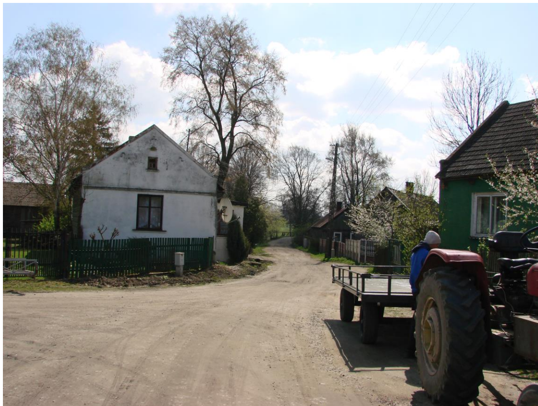
Fotografia 4. Droga gminna nr 107157E w kierunku Dzielnej.

Przez Wolę Załęzną przebiega również droga gminna 107157E Wola Załęzna – Dzielna o nawierzchni gruntowej w bardzo złym stanie – wymagająca budowy. Ponadto miejscowość jest pocięta siatką, w większości gruntowych, dróg dojazdowych do skupisk osadniczych i pól.