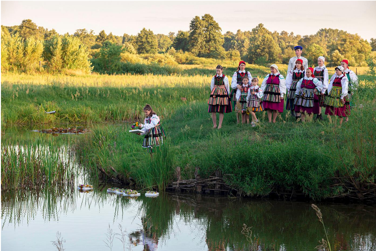
Fotografia 15: