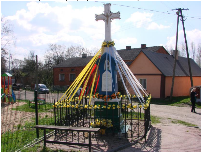
Fotografia 12. Kapliczka na rozstaju dróg z 1901 roku.

W Woli Załęźnej zlokalizowane są dwa krzyże przydrożne i dwie kapliczki.