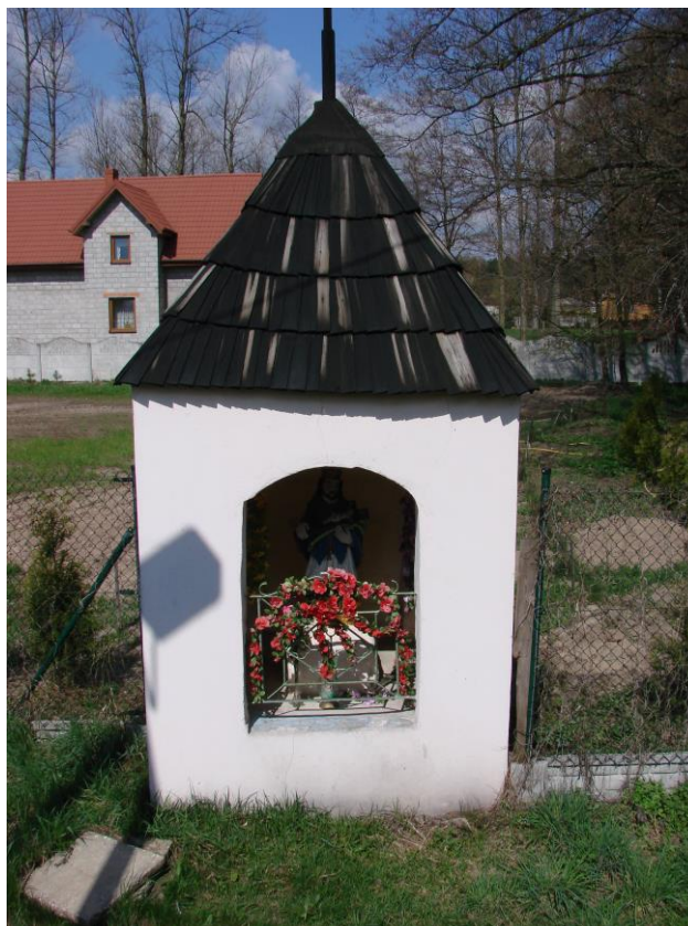
Fotografia 13. Kapliczka przydrożna.