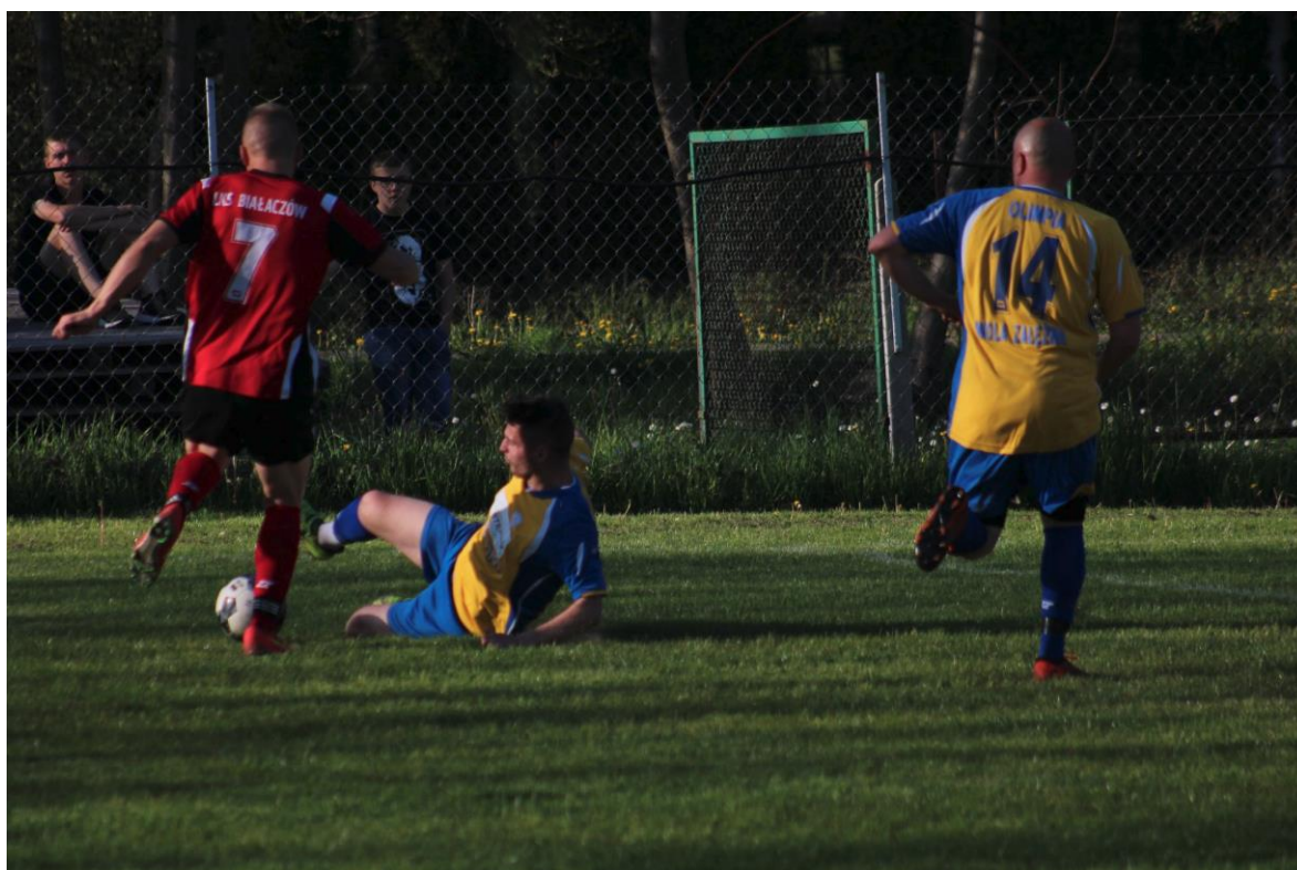
Fotografia 19: https://pl-pl.facebook.com/193086494066655/photos/pb.193086494066655.2207520000..7448176805224218/?type=3&theater