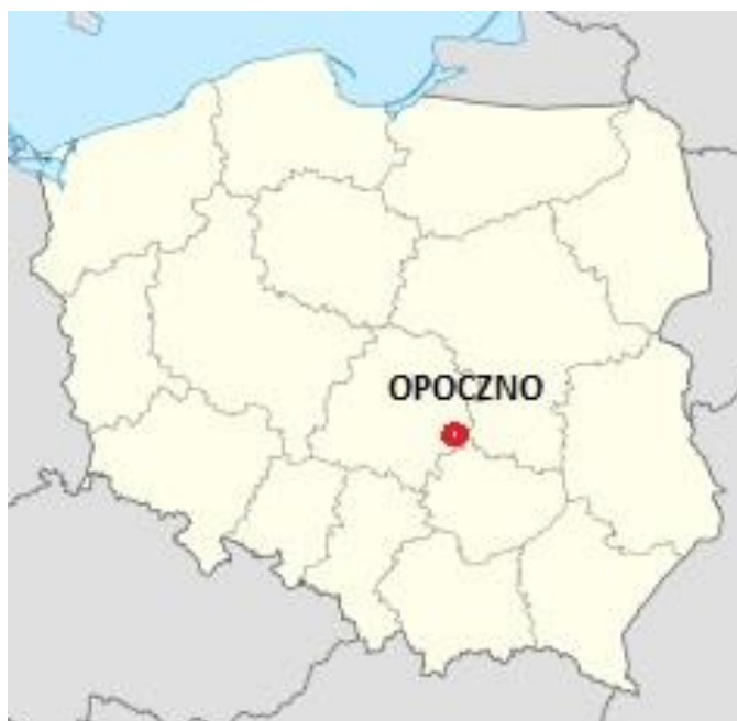
Mapa 1. Położenie gminy Opoczno na tle mapy Polski

Jej rozciągłość południkowa wynosi 20,2 km a równoleżnikowa 19,0 km.