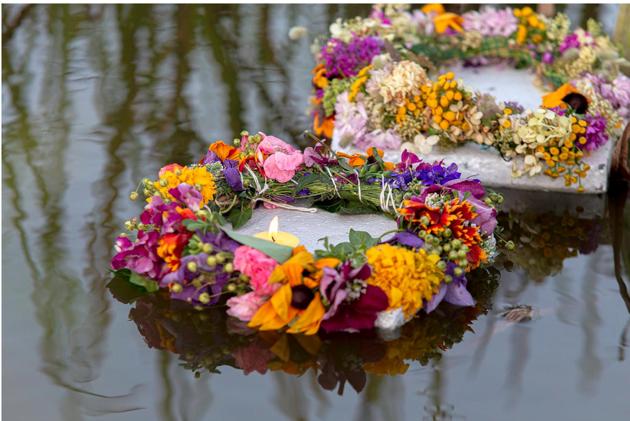
Fotografia 16: