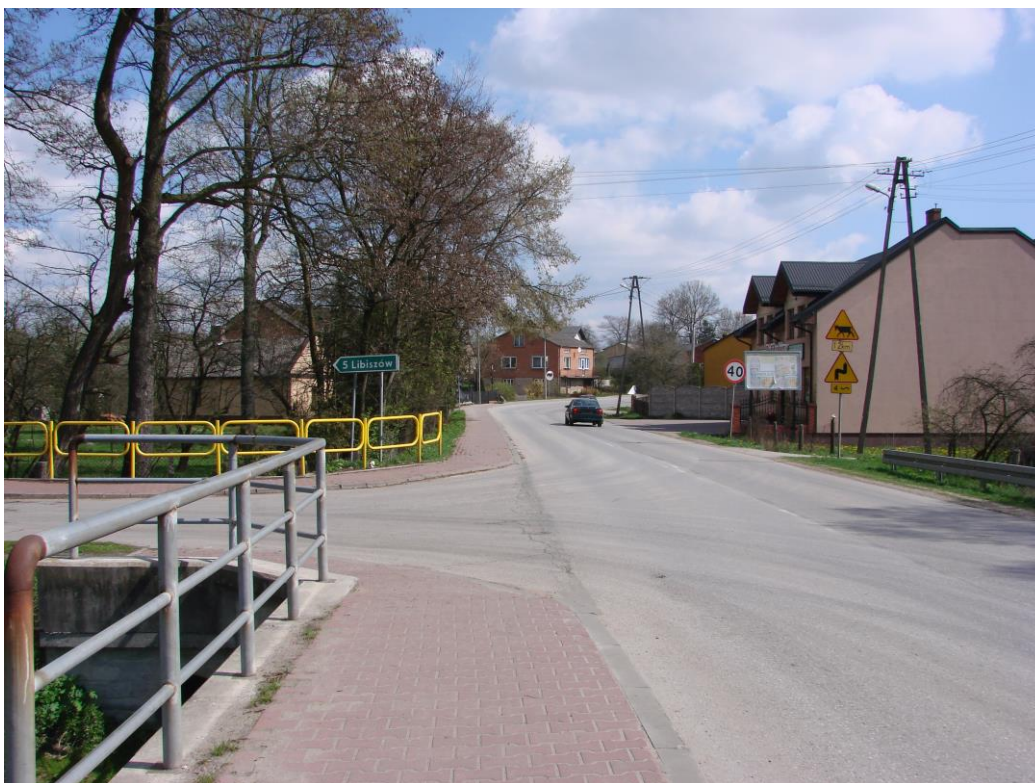
Fotografia 1. Droga powiatowa nr 3108E w kierunku Wygnanowa

Głównym ciągiem komunikacyjnym miejscowości Wola Załężna jest droga powiatowa 3108E Opczno – Drzewica. Droga klasy G, posiada nawierzchnię bitumiczną w dobrym stanie. Droga została zmodernizowana w 2007 roku w ramach projektu Powiatu Opoczyńskiego „Przebudowa drogi powiatowej nr 3108E na odcinku Opczno Wygnanów” dofinansowanego ze środków Unii Europejskiej w ramach Regionalnego Programu Operacyjnego Województwa Łódzkiego na lata 2007-2013.