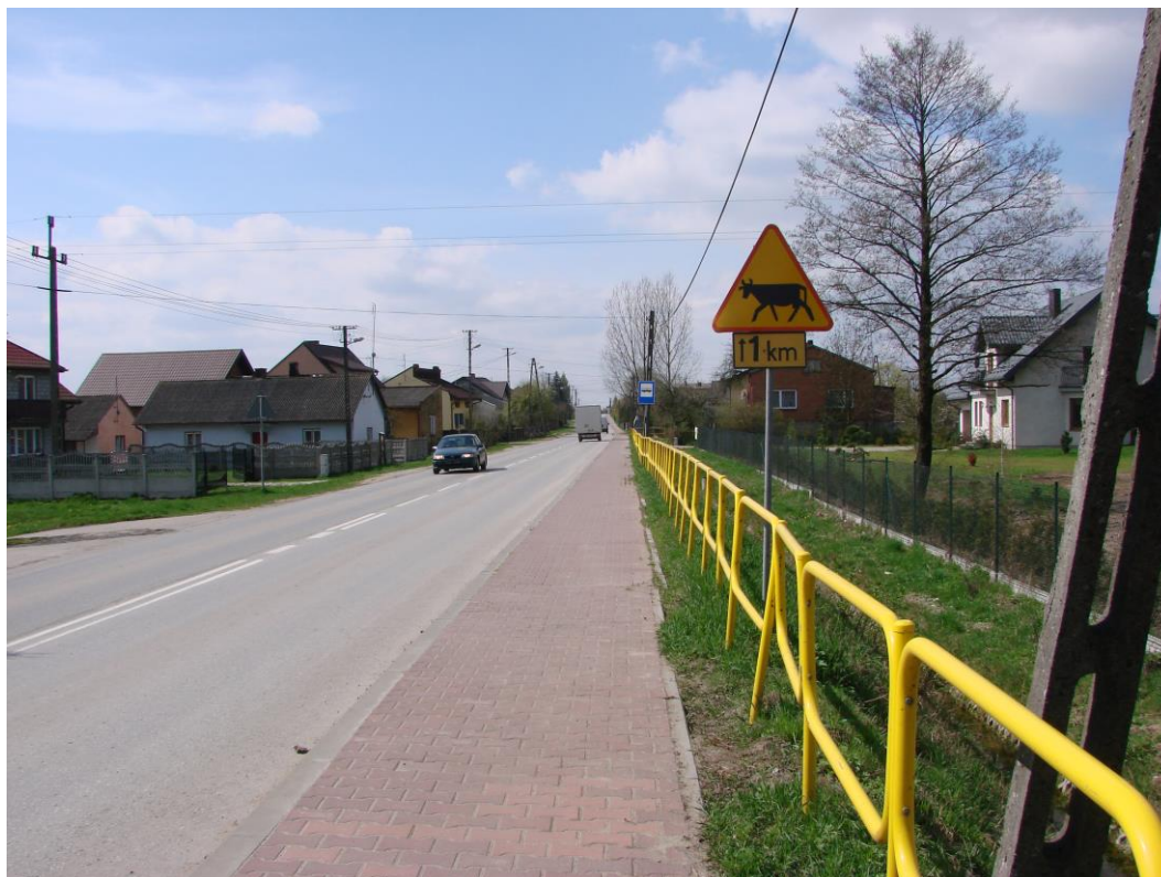
Fotografia 2. Droga powiatowa nr 3108E w kierunku Opoczna

Prostopadłą do 30138E jest droga powiatowa 3019E rozpoczynająca się w Woli Załęźnej, prowadząca do Drzewicy. Droga klasy G, o nawierzchni bitumicznej jest w bardzo złym stanie technicznym i wymaga całkowitej przebudowy.