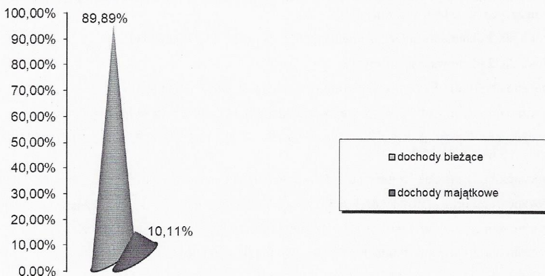
Wykres1 – udział grup dochodów w dochodach ogółem

Zestawienie porównania prognozowanych dochodów na rok 2022 w stosunku do planu dochodów według stanu na dzień 30 września 2021 roku przedstawia poniższa tabela: