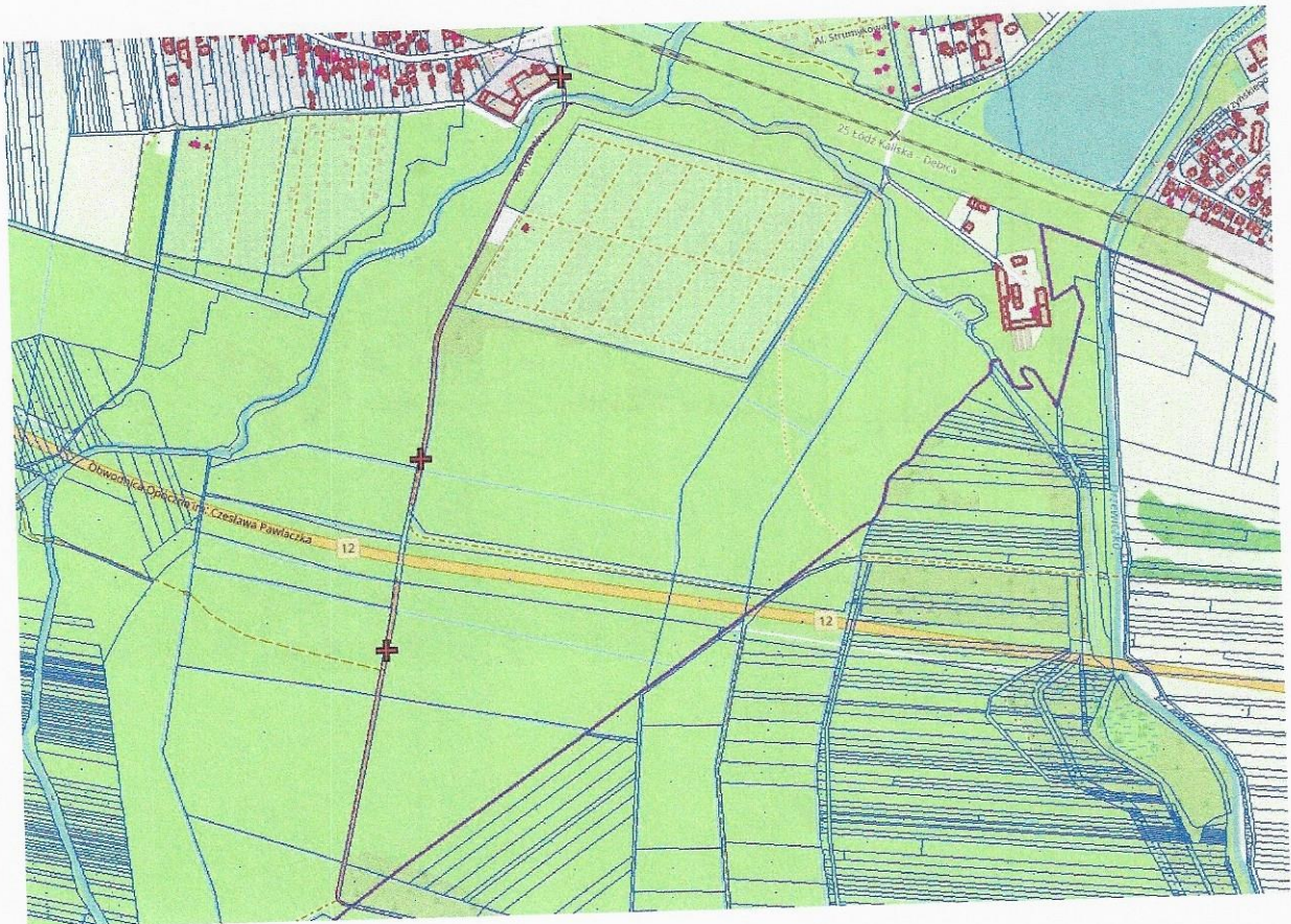
Miasto Opoczno, obręb 19, działki nr 44/2, nr 44/3 i nr 58