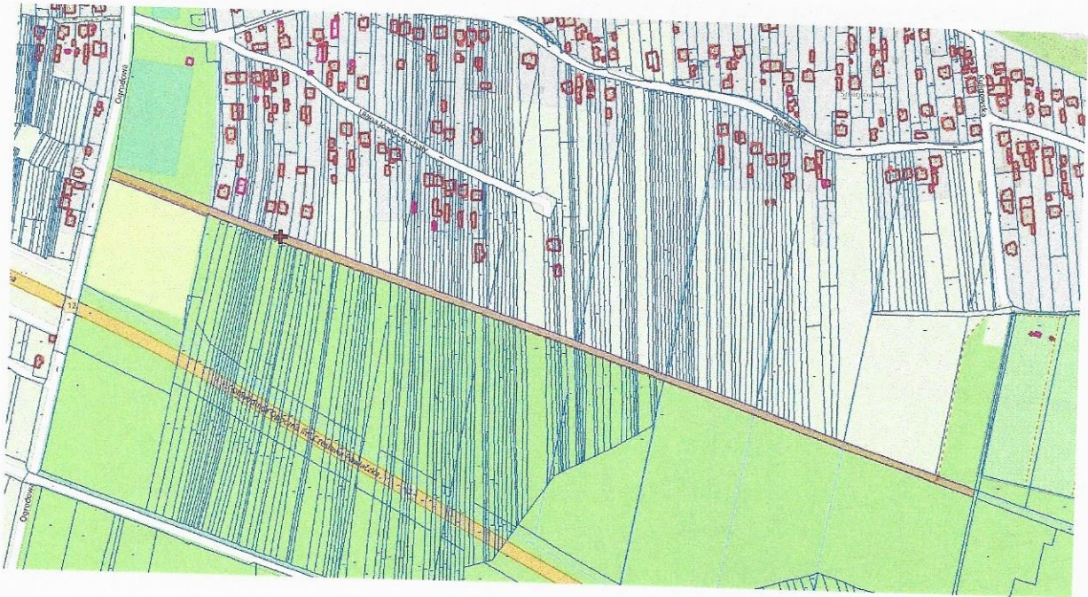
Miasto Opoczno, obręb 17, działka nr 444/1